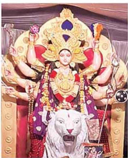
अध्धू मोहल्ला सिहोरा