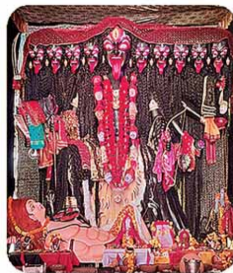
पोस्ट ऑफिस खितौला स्टैंड