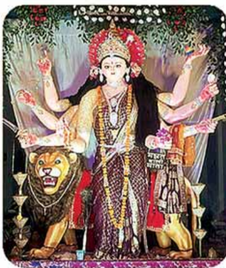
नया बस स्टैंड सिहोरा