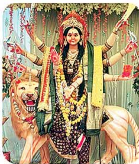
कटरा मोहल्ला रोड सिहोरा