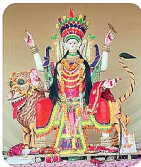
हिन्दी स्कूल सिहोरा