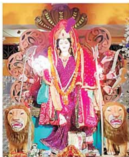
पालीवाल कॉलोनी खितौला