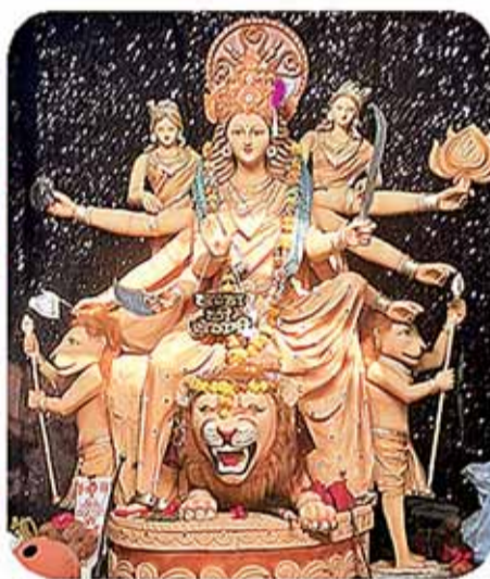
अंकुर समिति झंडा बाजार सिहोरा