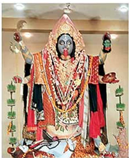
गढिया मोहल्ला सिहोरा