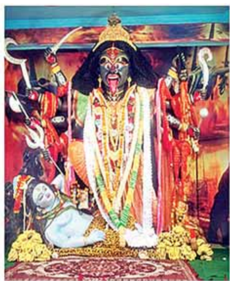
झंकार बाबाताल सिहोरा