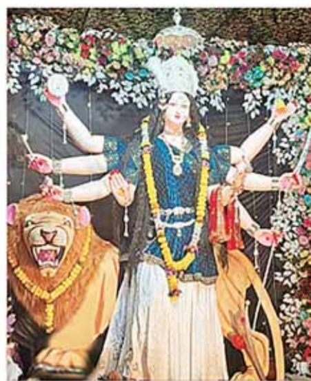
नव ज्योति झंडा बाजार